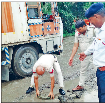
रेवाड़ी। बनीपुर चौक पर सड़क के गड्डे भरवाते ट्रैफिक पुलिस व बनीपुर चौक पर सड़क के गड्डे भरवाते ट्रैफिक पुलिस।