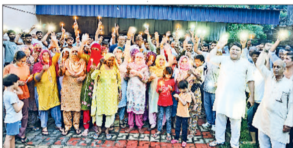
रेवाड़ी। बुड़ानी में कैडल मार्च निकालते ग्रामीण तथा गांव में जनसभा में मौजूद ग्रामीण।

रेवाड़ी। मॉडल टाउन थाना पुलिस ने सड़क हादसे के बाद फरार हुए बाइक चालक को गिरफ्तार किया है। थाना क्षेत्र में बीते 25 जुलाई को बाइक की चपेट में आकर एक व्यक्ति घायल हो गया था।