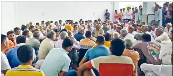
रेवाड़ी। पंचायत में मौजूद मसीत के ग्रामीण।