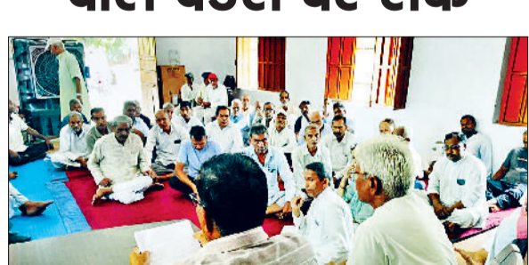
हरिभूमि न्यूज ►► कोसली