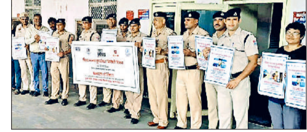
रेवाड़ी। मानव तस्करी दिवस पर लोगों को जागरूक करती आरपीएफ टीम।

हथियार रखने के जुर्म में जेल में थे। उधम सिंह 1931 में वाया जर्मन होते हुए लंदन गए। वहां पर रहकर उन्होंने होटल में काम किया। एक दिन जलिल खरीदी और एक दिन उन्होंने पन्टरल डायरी के 31 गोली मारा दी, जिससे उनका 21 साल पुराना नसूबा पूरा हुआ। 1931 में उधम सिंह को जेल में डाल दिया गया।