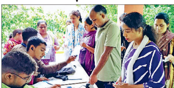
रेवाड़ी। परीक्षा केंद्र में बायोमेट्रिक हाजरी लगाते परीक्षार्थी, केएलपी कॉलेज से परीक्षा देकर बाहर आते अभ्यर्थी तथा परीक्षार्थी की जांच करती पुलिस