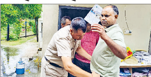
इनकों ले जाने की नहीं मिली अनुमति