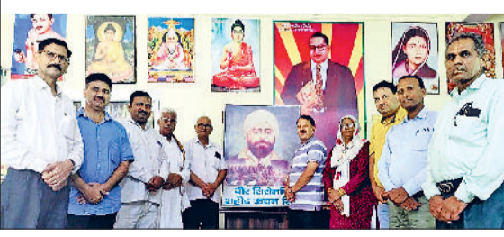
रेवाड़ी। शहीदी उधम सिंह को श्रद्धांजलि अर्पित करते हुए।