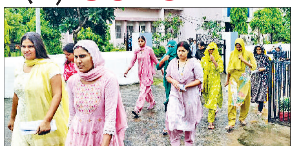
पूरी तरह जांच के बाद परीक्षा केंद्रों में एंट्री